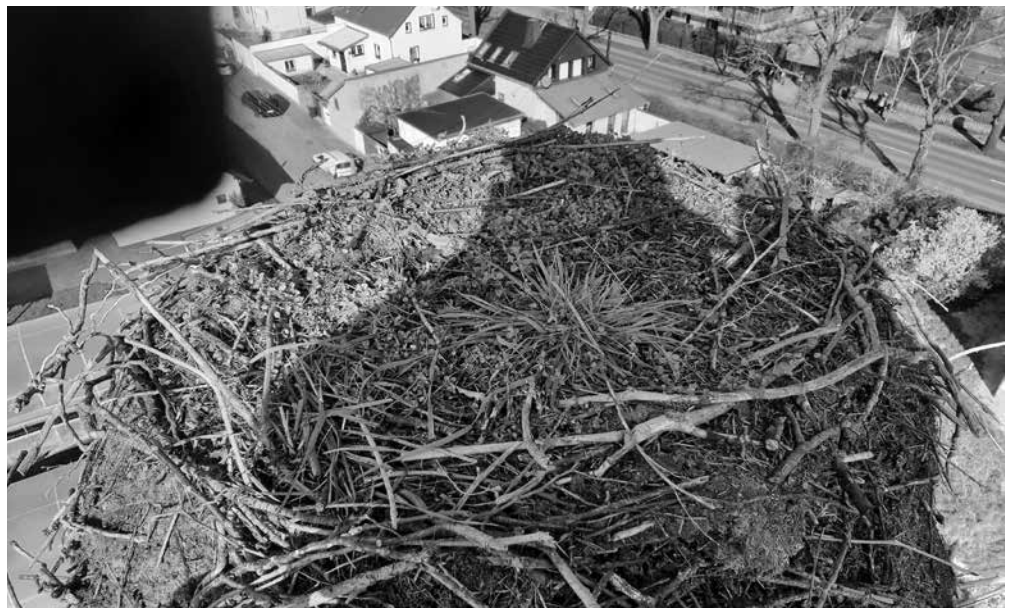
Blick in den sanierten Lützschenauer Storchhorst

Dass im Herbst und im Frühjahr in den Nestern so einiges grünt und sprießt ist ganz normal, bedenkt man, dass die Störche beim Nestbau auch